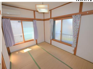
② Комната на двоих