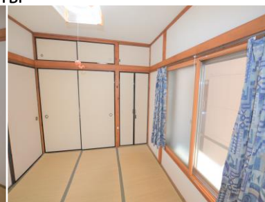
③ Комната на двоих