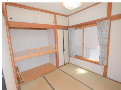
① Комната на двоих