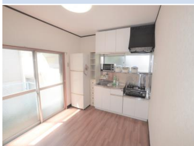
ห้องครัว