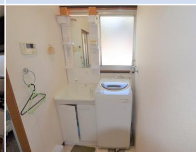
ห้องซักผ้า