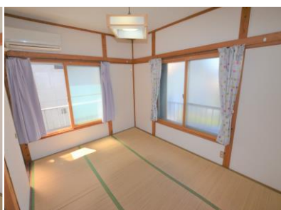
ห้อง 2 คน ②