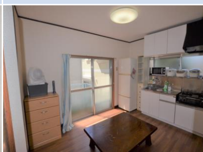
ห้องรับประทานอาหาร