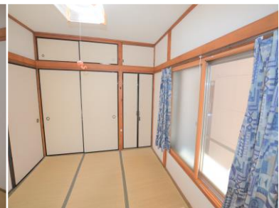
Phòng 2 người ③