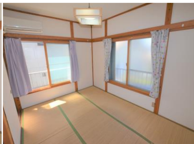
Phòng 2 người ②