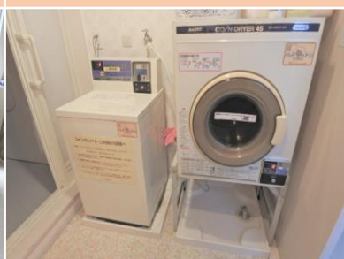
Khu giặt, sấy