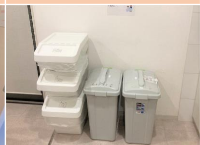
Thùng phân loại rác