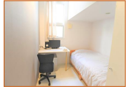
Phòng đơn loại - A

<từng phòng> ( giường ngủ hoặc gác xếp) chăn, nệm, điều hòa, bàn, ghế, tủ lạnh mini, Tivi mini, tủ âm tường, Wi-Fi.