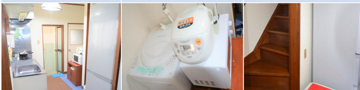
ห้องครัว