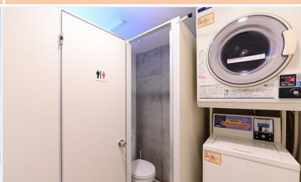
ห้องซักผ้า