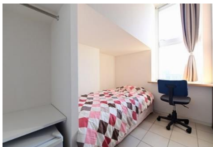
ห้องส่วนตัว