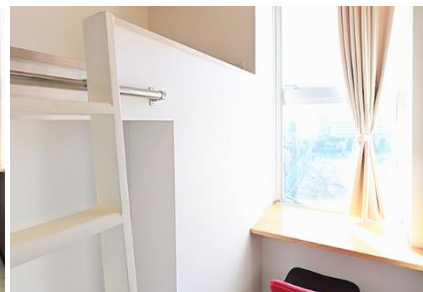
ห้องส่วนตัว