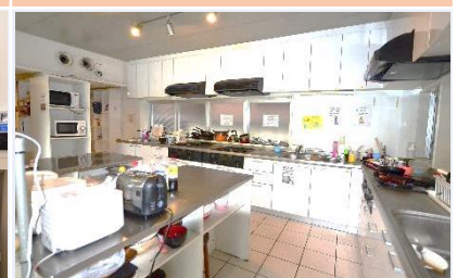
ห้องครัว