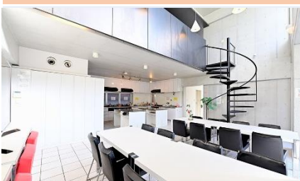
พื้นที่ส่วนกลาง