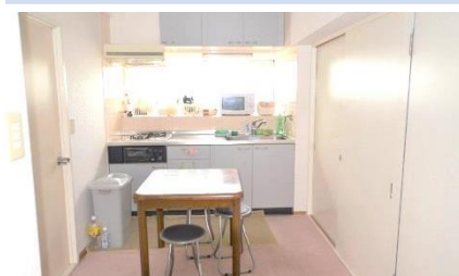
ห้องรับประทานอาหาร