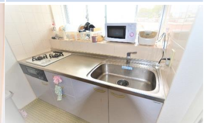
ห้องครัว