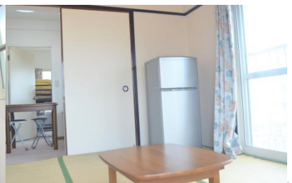
ห้องเดี่ยว ③