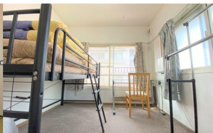
ห้องเดี่ยว ②