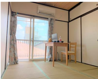
Phòng riêng ①