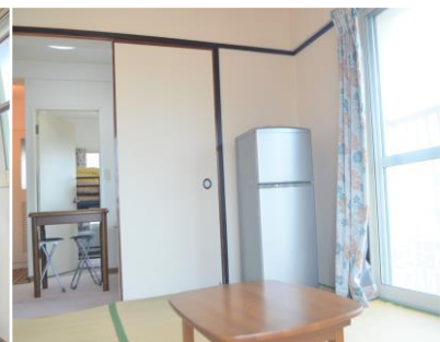
Phòng riêng ③