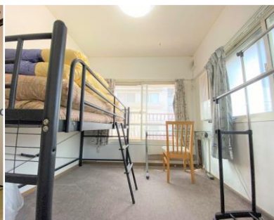
Phòng riêng ②