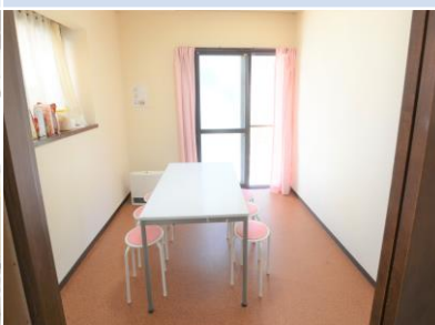
ห้องรับประทานอาหาร