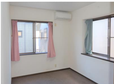
ห้องพัก 2 คน ①