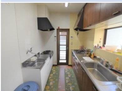
ห้องครัว