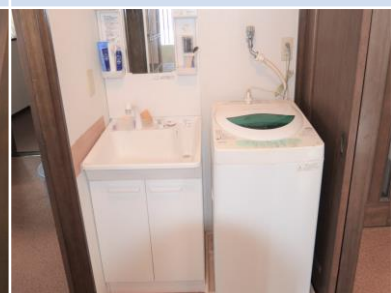
ห้องซักผ้า