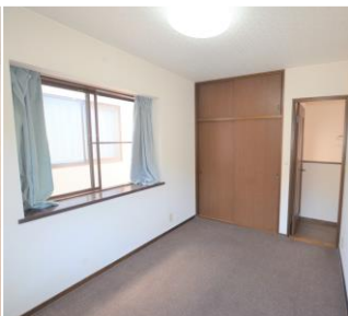
ห้องพัก 2 คน ②