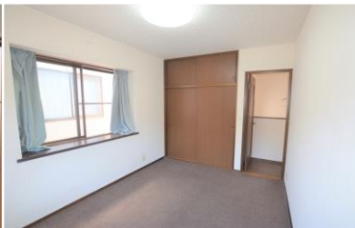
Phòng 2 người ②