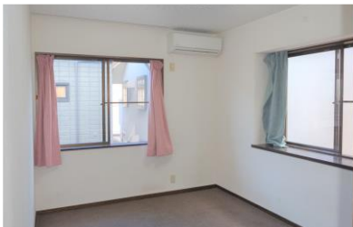
Phòng 2 người ①