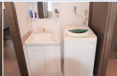
Nơi giặt ủi