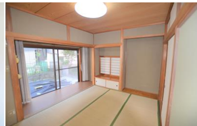
Phòng 3 người