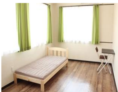
Комната на одного