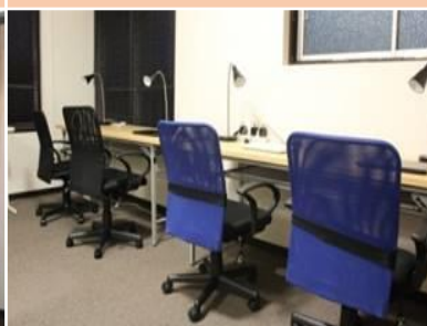
Место для занятий