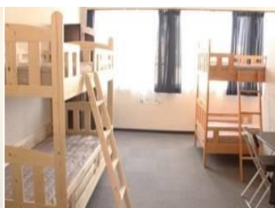
Комната на четверых