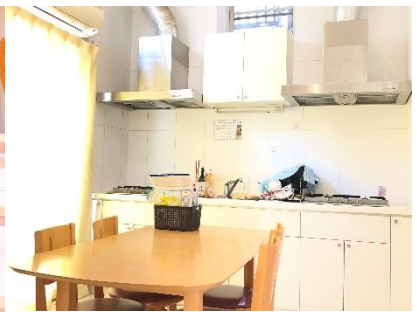
ครัวและห้องกินข้าว