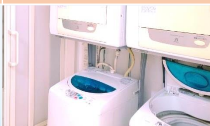
ห้องซักผ้า